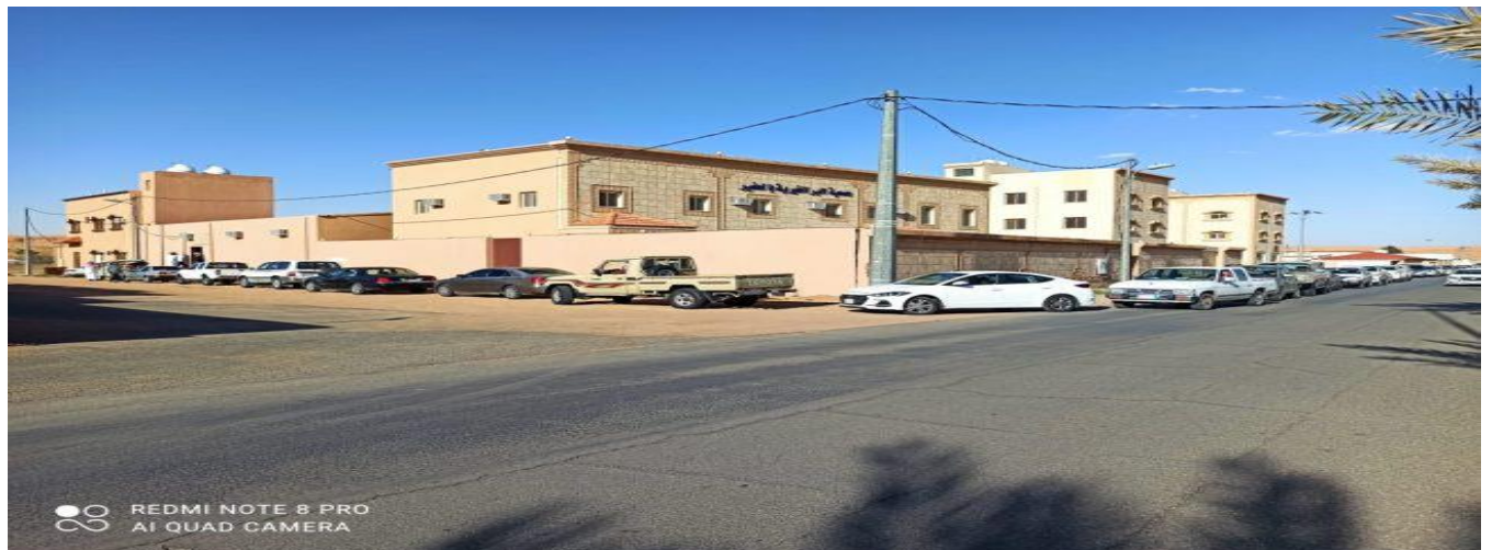
4 - مشروع توزيع سلة العجيمي الخيرية وكميات من التمور